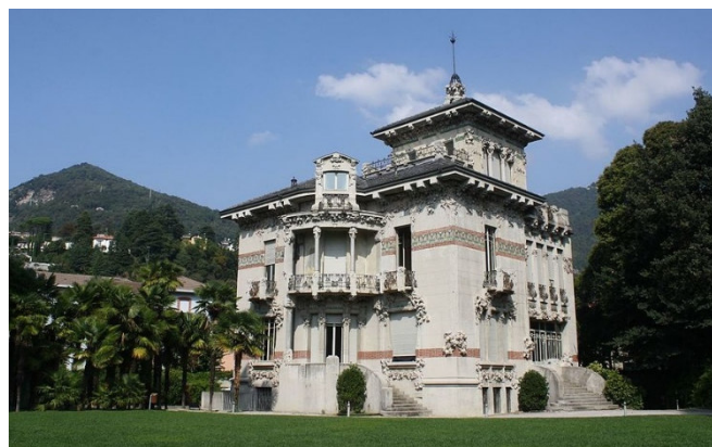
Villa Bernasconi in Cernobbio

Zu Beginn fahren Sie in das Dorf Cernobbio , nahe der Schweizer Grenze. Hier besichtigen Sie mit der Villa Bernasconi ein wahres Kleinod des italienischen Jugendstils. Sie wurde Anfang des 20. Jh. erbaut und zählt zu den eindrucksvollsten Villen dieser Epoche in der Region. Mit geschwungenen Formen, floralen Dekorationen, detailreichen Ausgestaltungen und auch schmiedeeisernen Elementen schuf der Architekt ein wahres Meisterwerk , das sich durch die Nähe zum Comer See und die umliegende Landschaft perfekt in die Umgebung einfügt.